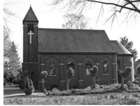
Moeselkerk 100 jaar oud