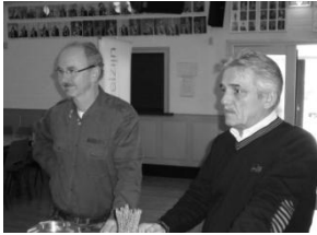
Voorzitter oud en nieuw

Woensdag 23 mei 2012 van 19.30 tot 22.30 uur in Buurtcentrum Moesel