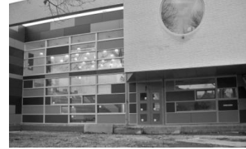
Brede school 0 jaar nieuw

We bespreken met u via muurkranten en foto's wat de wijkraad in 2012 doet. We vragen uw inbreng bij verbetervoorstellen voor de leefbaarheidagenda 2013