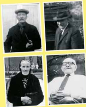
Van het spoor tot aan de Dijkerstraat, van de Moeselpeel tot aan de Oudenakkerstraat.