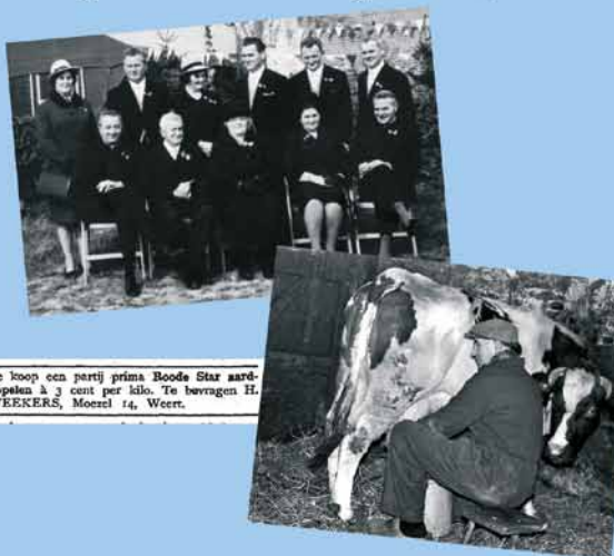
Te koop een partij prima Boods Star aardappelen à 3 cent per kilo. Te bevragen H. WEEKERS, Moesel 14, Weert.

Maar het boek is ook aangevuld met de geschiedenis van de Moeselkapel, evenals die van de voetbalclub en de harmonie. Over de Heilige boom is een artikel geschreven, even-