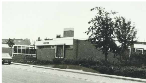
Groene Kruis Gebouw Nassaulaan 1977