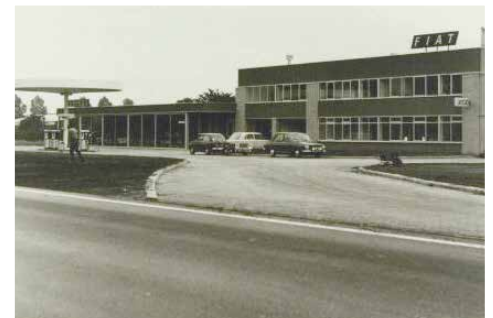
Fiat Garage 1973