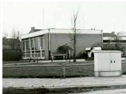
BS Nassauhof 1976