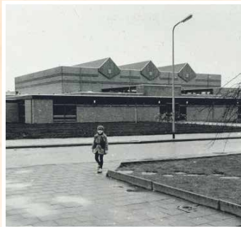
Microhal Nassaulaan 1973