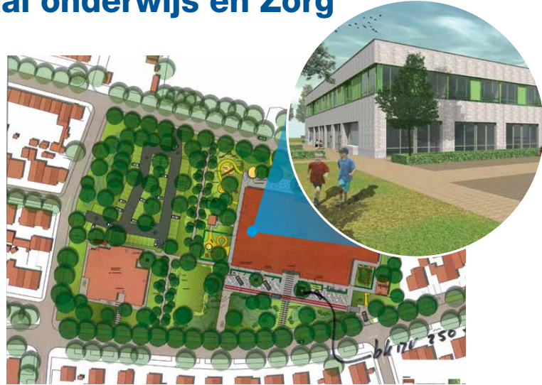
2.0 Architecten BV.

In het complex komt een sporthal welke onderverdeeld kan worden in twee gymzalen. De gymzalen worden in eerste aanleg gebruikt door leerlingen die het RKEC bezoeken. De zalen zullen in de avonden en weekenden beschikbaar zijn voor gebruik door sportverenigingen. De gemeente gaat over het inplannen van het gebruik