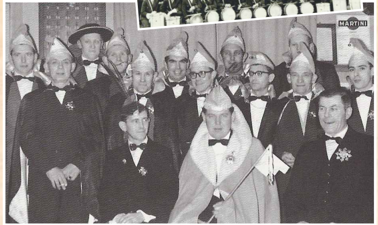
Eerste Prins VV De Vêrkusköp 1961