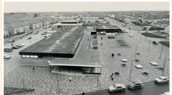
Winkelcentrum Moesel 1973