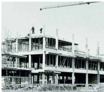
Bouw Drakesteyn 1971