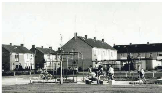
Johanna van Polanenstraat 1971