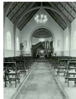
Lourdeskapel Moesel 1971