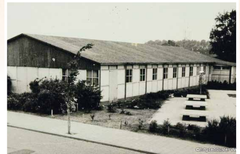
Noodkerk Moesel 1972