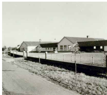
Biologische School 1959